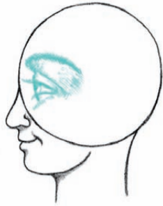
מתבונן על העולם החדש